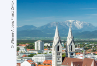
DIE WIENER ALPEN SIND IMMER EINEN AUSFLUG WERT.

In Wiener Neustadt geht die Landesaustellung 2019 über die Bühne. Abgesehen davon ist die Stadt immer einen Ausflug wert. Alleine schon wegen der historischen Innenstadt mit dem imposanten Dom und der Burg Wiener Neustadt.