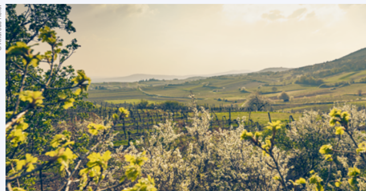
OPTISCHER GENUSS: DAS FRÜHLINGSERWACHEN IM WIENERWALD.