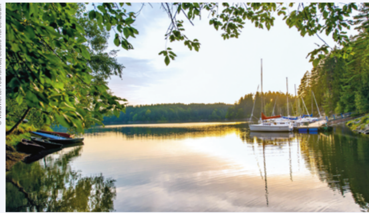
DER STAUSEE OTTENSTEIN IST EIN FREIZEITPARADIS.