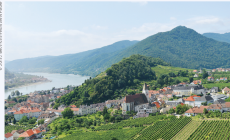
DIE DONAU IST DIE LEBENSADER NIEDERÖSTERREICHS.