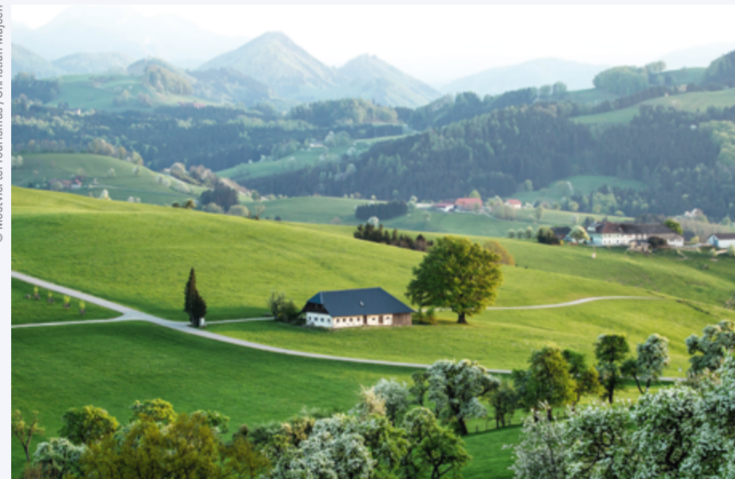
DAS MOSTVIERTEL SPIELT LANDSCHAFTLICH ALLE STÜCKE.