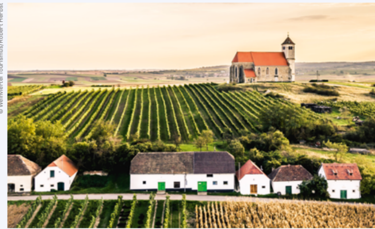
KELLERGASSEN UND PRESSHÄUSER PRÄGEN DAS WEINVIERTEL.